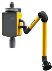
WallPro Single mit direkt montiertem (DM) Absaugarm