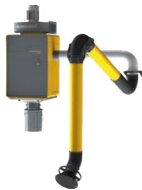
WallPro Single mit extern montiertem (EM) Absaugarm