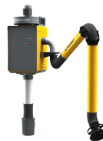
Optional: Staubbehälter- Erweiterungssatz

* Für eine vollständige Auflistung aller Konfigurationen wenden Sie sich bitte an Ihren Verkaufspartner.